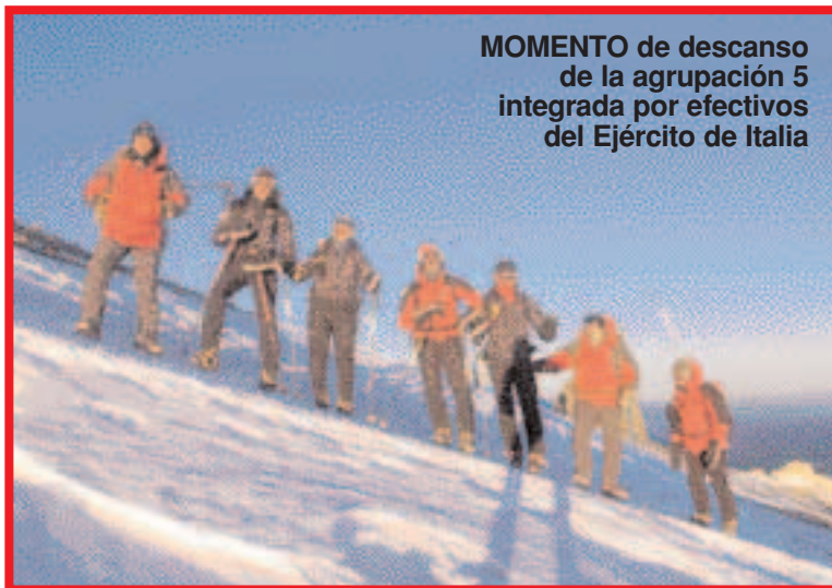
MOMENTO de descanso de la agrupación 5 integrada por efectivos del Ejército de Italia