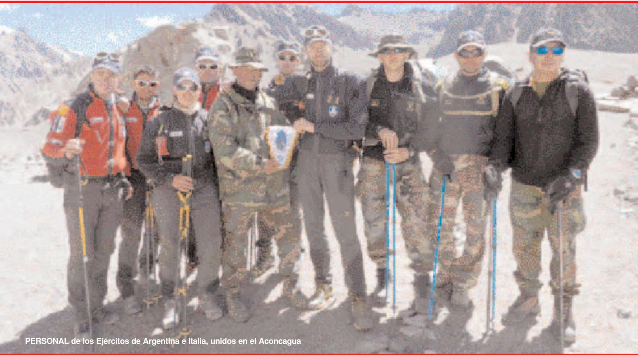
PERSONAL de los Ejércitos de Argentina e Italia, unidos en el Aconcagua

Con el fin de adiestrar al personal de la Brigada de Montaña VIII en técnicas de andinismo y experiencia en altura bajo condiciones desfavorables durante enero se realizaron expediciones al cerro Aconcagua. Asimismo, para capacitar a los efectivos de la Compañía de Cazadores de Montaña 8 que oficiarán de guías en futuras ascensiones. Junto al personal argentino, participó de la empresa una cordada del ejército italiano