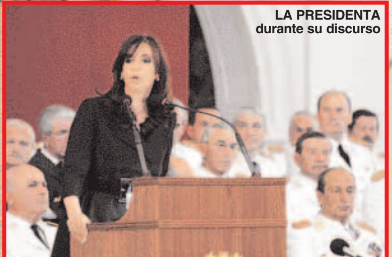
LA PRESIDENTA durante su discurso