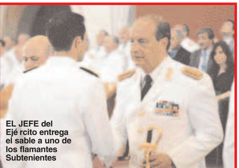
EL JEFE del Ejército entrega el sable a uno de los flamantes Subtenientes