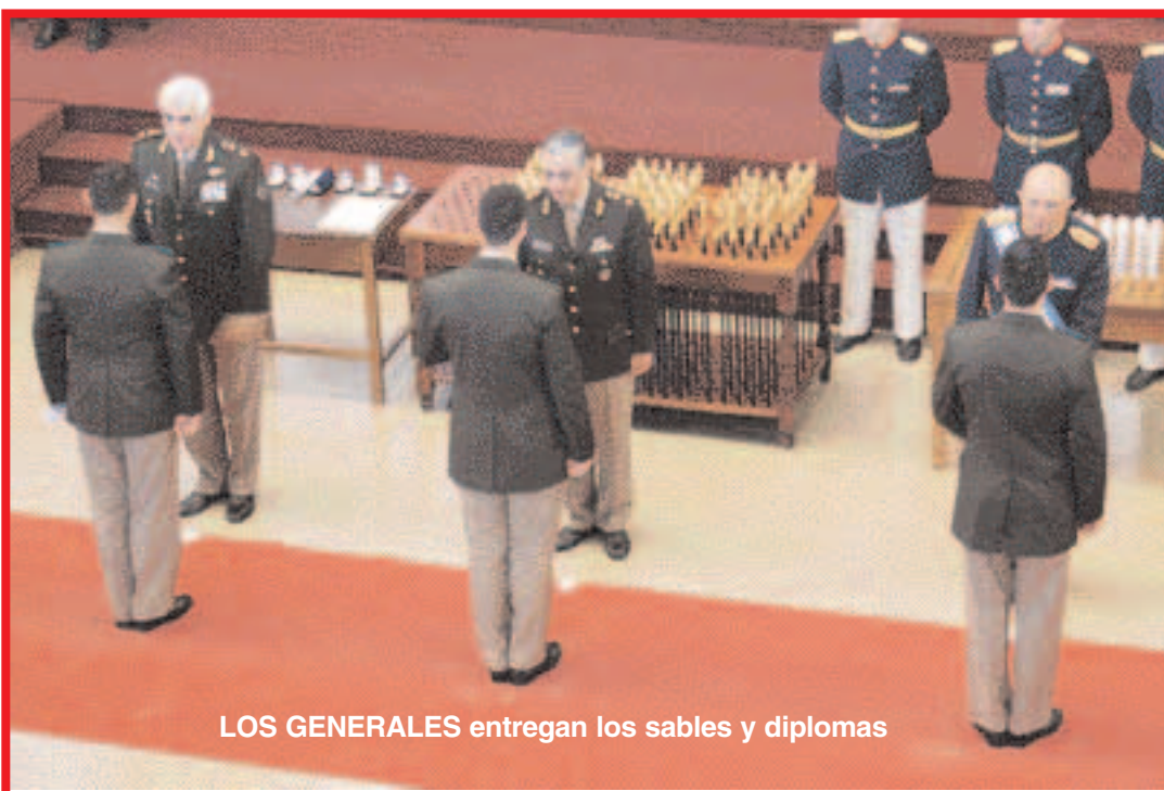
LOS GENERALES entregan los sables y diplomas

Por último, se entregaron los premios, sables y despachos a los cadetes y luego se procedió a descubrir la columna en la que figuran los nombres de los integrantes de la Promoción 141° del Colegio Militar de la Nación