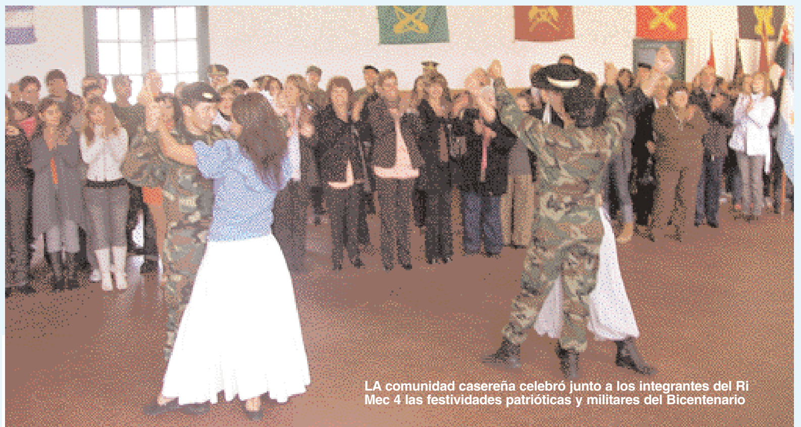
LA comunidad casereña celebró junto a los integrantes del RI Mec 4 las festividades patrióticas y militares del Bicentenario