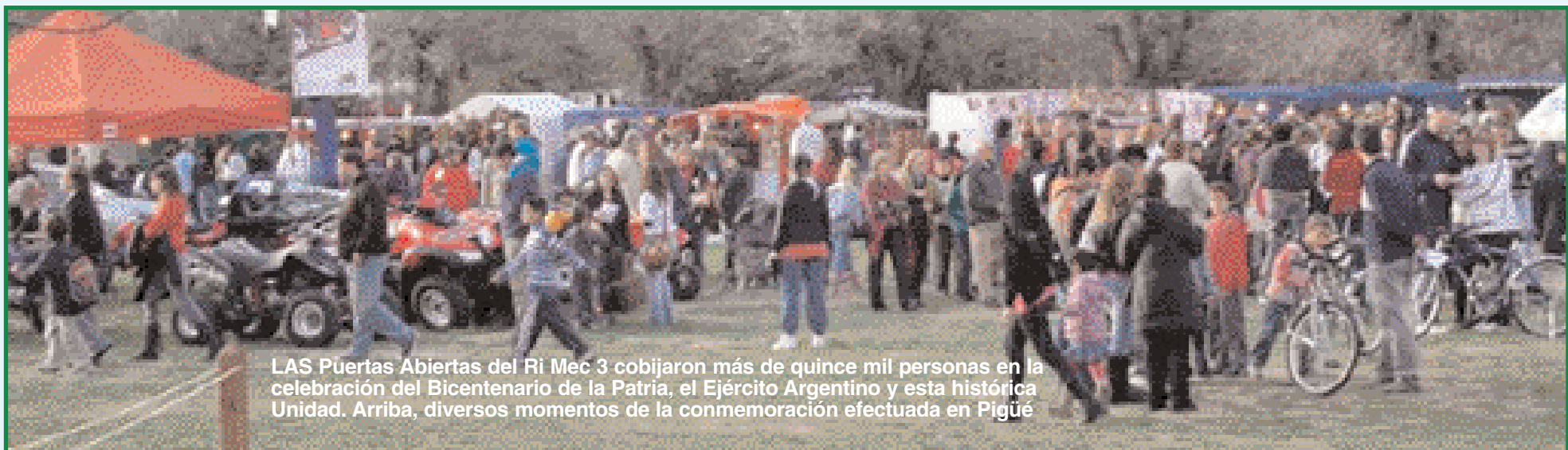
LAS Puertas Abiertas del RI Mec 3 cobijaron más de quince mil personas en la celebración del Bicentenario de la Patria, el Ejército Argentino y esta histórica Unidad. Arriba, diversos momentos de la conmemoración efectuada en Pigüé