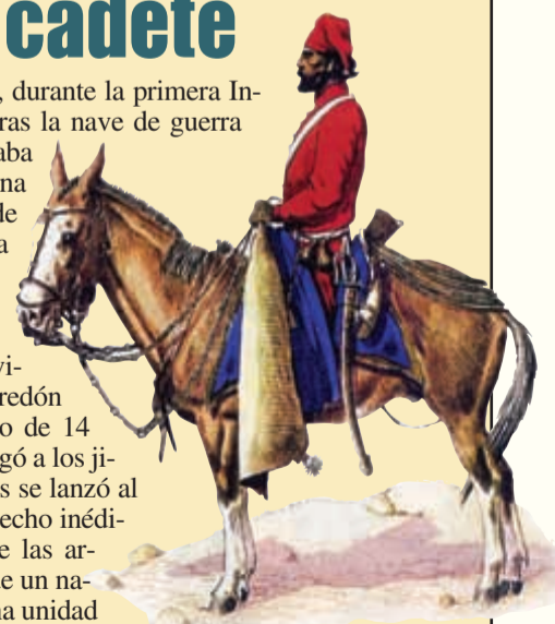
Imagen de un Infernal de Güemes

E l 12 de agosto de 1806, durante la primera Invasión Inglesa y mientras la nave de guerra británica "Justine" cañoneaba el fuerte de Buenos Aires, una imprevista bajante del Río de la Plata la dejó encallada frente a la costa. Al advertirlo, los defensores indicaron a un joven cadete del Regimiento Fijo de Salta que avisara a los Húsares de Puyerradón para atacarla. El muchachito de 14 años hizo más que eso. Arengó a los jinetes patriotas y junto a ellos se lanzó al ataque, protagonizando un hecho inédito en la historia mundial de las armas. El abordaje y la toma de un navío de guerra por parte de una unidad de caballería. Aquel joven cadete se llamaba Martín Miguel de Güemes, futuro líder de la guerra gaucha