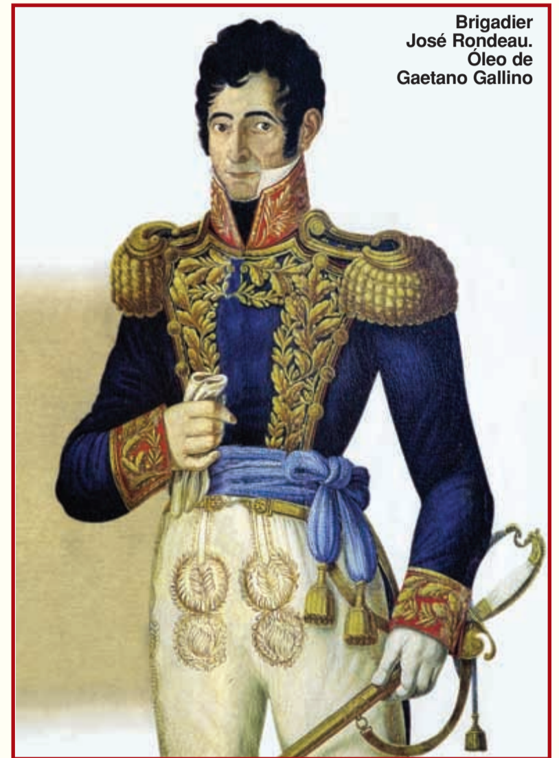
Brigadier José Rondeau. Óleo de Gaetano Gallino

toria en el Alto Perú quedaban definitivamente sepultadas luego de esta confrontación. Ahora, los ejércitos realistas tenían las manos libres para avanzar. Pero en su camino iban a encontrar a Güemes y sus milicias. Serían estos bravos quie-