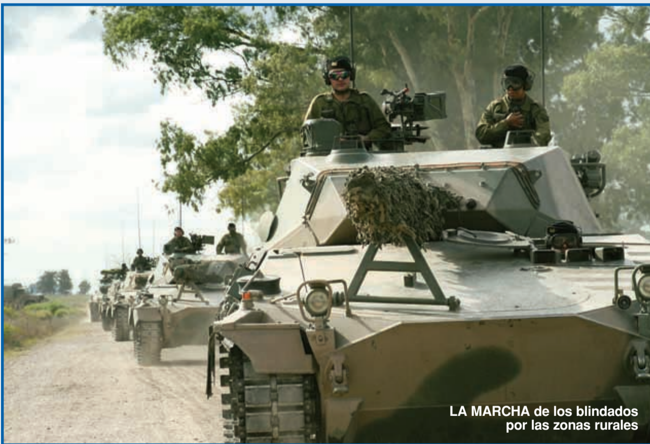
LA MARCHA de los blindados por las zonas rurales