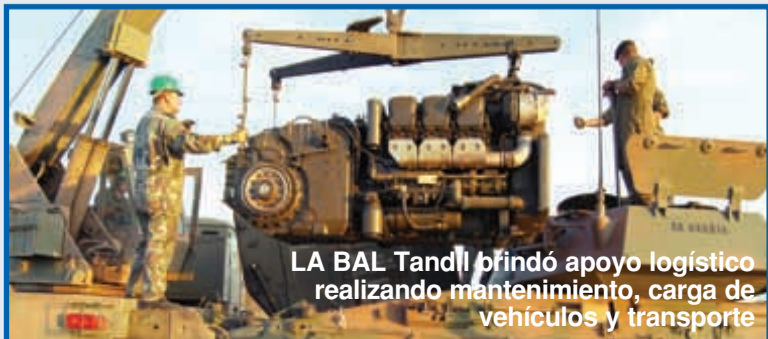
LA BAL Tandi brindó apoyo logístico realizando mantenimiento, carga de vehículos y transporte