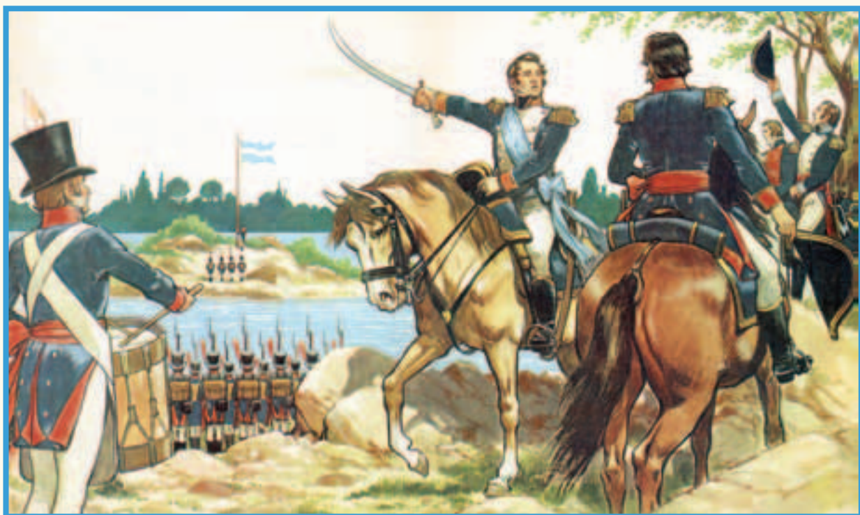
A orillas del río Paraná, junto a las baterías Libertad e Independencia, el General Manuel Belgrano hizo jurar la enseña celeste y blanca por él creada. Ilustración de Alberto Salinas