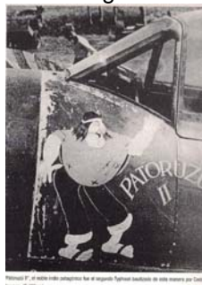
Patoruzú pintado en el morro de un Spitfire

- La mayoría de los descendientes de ingleses trabajaban en los ferrocarriles, pero muchos lo hacían en la Fábrica Argentina de Alpargatas que era británica. Tenían entre 18 y 20 años y recibían de obsequio los conocidos almanques con aquellos dibujos de Molina Campos. Cuando fueron a la guerra, la empresa les siguió pagando el sueldo durante los años en que combatieron. Además, les guardaron sus puestos y por todo eso, les enviaron estos almanques también a Inglaterra como alegoría de Alpargatas.